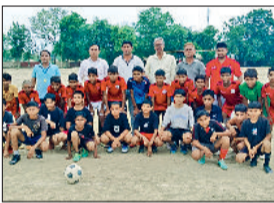
उद्याना। फुटबॉल अंडर 17, 14 के विजेता खिलाड़ी।