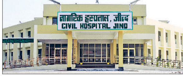
जींद। नागरिक अस्पताल जींद।

अगर आज आप सरकारी अस्पतालों में उपचार के लिए आ रहे हैं तो आपको दस से 11 बजे तक स्वास्थ्य सेवाओं से मरहूम रहना पड़ सकता है। हालांकि एमरजेंसी, डिलीवरी तथा पोस्टमार्टम सेवाएं उपलब्ध होंगी लेकिन जनरल ओपीडी, दवा वितरण सहित अन्य कई तरह के कार्य ठप रहेंगे। यह निर्णय स्वास्थ्य विभाग की हरियाणा सिविल मेडिकल सर्विस एसोसिएशन, दंतक सर्जन एसोसिएशन, लेब टेक्नीशियन एसोसिएशन, नर्सिंग ऑफिसर