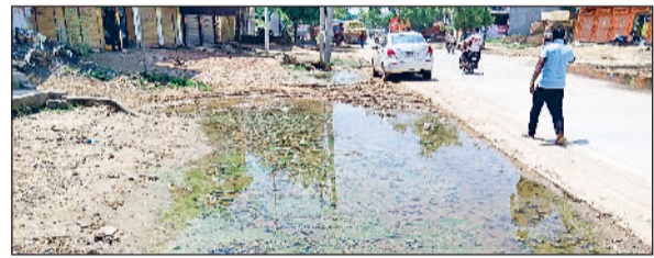
जीद । जमा पानी के नीचे दबे चैंबर ।

नरवाना रोड पर सीसी की बनाई गई सड़क के साथ बनाए गए बरसाती पानी निकासी चैंबरों को विभाग बना कर उन्हें चालू करना भूल गया है। सड़क के दोनों ओर बरसाती पानी जमा हो रहा है। जिसके चलते लोगों को भी भारी परेशानी का सामना करना पड़ा। सड़क के साथ बने चैंबर खोल उन्हें चालू करने की लेकर लोग डीसी समेत अधिकारियों से मिल चुके हैं। लिखित में शिकायत भी दे चुके हैं। डिप्टी स्पीकर डा. कृष्ण मिश्रा ने समास्या के समाधान को लेकर आदेश दे चुके हैं। बावजूद इसके समस्या का समाधान नहीं