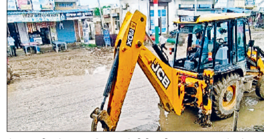
कैथल। जींद रोड पर पाषंड द्वारा जेसीबी मशीन मंगवाकर गहरे गड्ढे पर पथर रखते हुए।