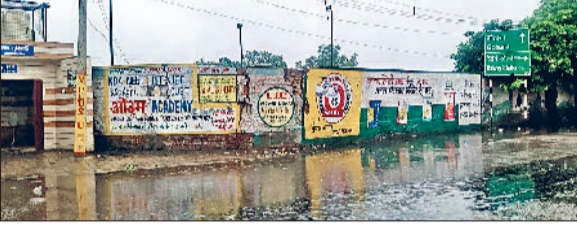
जींद। रानी तालाब की दीवार जो कभी भी गिर सकती है।