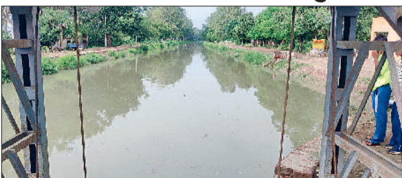
कैथल। कलायत स्थित सरसा बांध नहर।