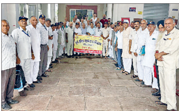
कैथल। हनुमान वाटिका में पूर्व सैनिक वेलफेयर एसोसिएशन के पदाधिकारी।

पॉलीक्लिनिक कैथल में सब एरिया हेड क्वार्टर की टीम स्पर्स पेंशन में