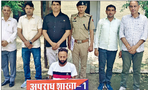
कैथल। सी आई ए-1 पुलिस गिरफ्त में चोरी का आरोपी।