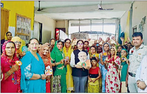
जीद । राखियां भेजती महिलाएं ।