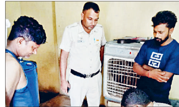
कैथल। पूछताछ करते पुलिस टीम के सदस्य।