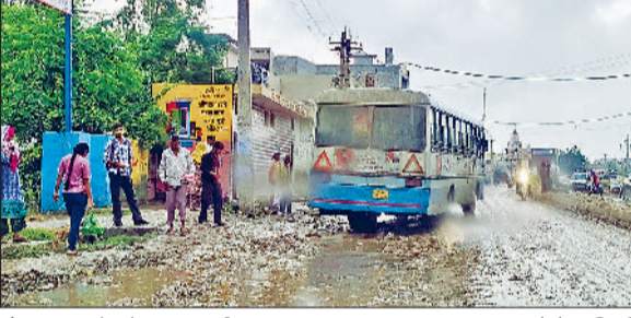
कैथल। राजौद के मुख्य मार्ग का दृश्य।