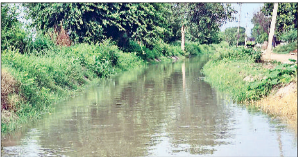
उचाना । लबालब पानी से भरा रजबाहा ।