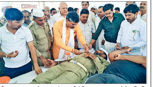
जींद। रक्तदाता का हौसला बढ़ाते हुए मंत्री बेदी।

बी आर अम्बेडकर भवन निर्माण बिजली लाईन बदलवाने पर पाईप लाईन बदलवाने पर खेतों ए ढाणियों के रास्ते को पक्का करने ए लाईब्रेरी ए क्यूबिटी सैंटर सभी चेपालों का निर्माण शमषान घाट की चार दिवारी व मुख्य द्वार पार्क का निर्माण पंचायत भवन व आंगनवाड़ी भवन निर्माण स्टेडियम निर्माण तथा ज्योतिभाई भवन निर्माण सहित सभी मांगों को पूरा करवाने का आश्वासन दिया। उन्होंने इसके लिए अधिकारियों को जल्द ही एस्टीमेट बनाने के लिए कहा और बताया कि इन सभी कार्यों पर करीब 2 से अढ़ाई करोड़ रूपय खर्च आएंगे।