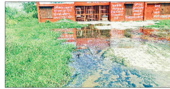
कैथल। राजौद पैक्स प्रांगण में जोहड़ का पानी ओवरफ्लो होकर भरा।

बाता दें कि यहां पैक्स में किसान खाद बीज आदि लेने के लिए आते हैं। लेकिन चारों तरफ पानी ही पानी भरा हुआ है जिससे उन्हें भारी परेशानी उठानी पड़ती है। इतना ही नहीं यहां की गली भी पूरी तरह