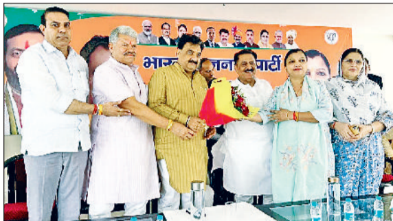
कैथल। डॉ. कृष्ण मिश्रा और सुभाष सुधा का स्वागत करते भाजपा नेता।

इस अवसर पर हरियाणा विधानसभा के उपाध्यक्ष डॉ. कृष्ण मिश्रा एवं हरियाणा सरकार के पूर्व मंत्री सुभाष सुधा विशेष रूप से उपस्थित रहे। उन्होंने आगामी 14 अगस्त 2025 को फरीदाबाद में आयोजित होने वाले विभाजन विभीषिका स्मृति दिवस के प्रदेश स्तरीय कार्यक्रम को लेकर