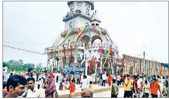
हटकेश्वर धाम में पूजा करते हुए श्रद्धालु ।