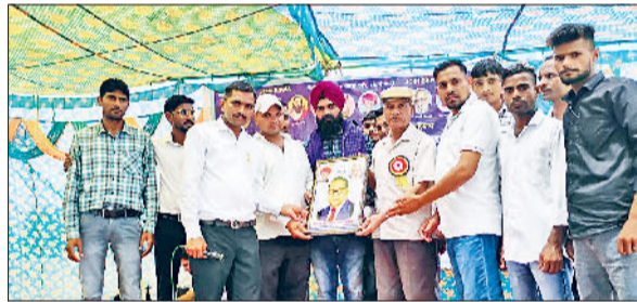
कलायत। युवाओं को सम्मानित करते पदाधिकारी